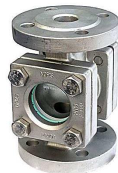
DN 15 - 50 ( Deckel quadratisch )