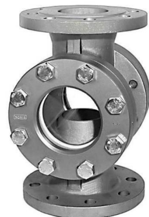
DN 65 - 250 ( Deckel rund )